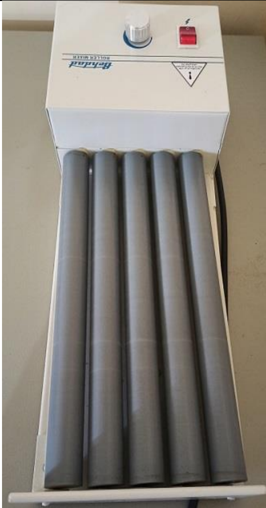
میکسر هماتولوژی Hemathological mixer