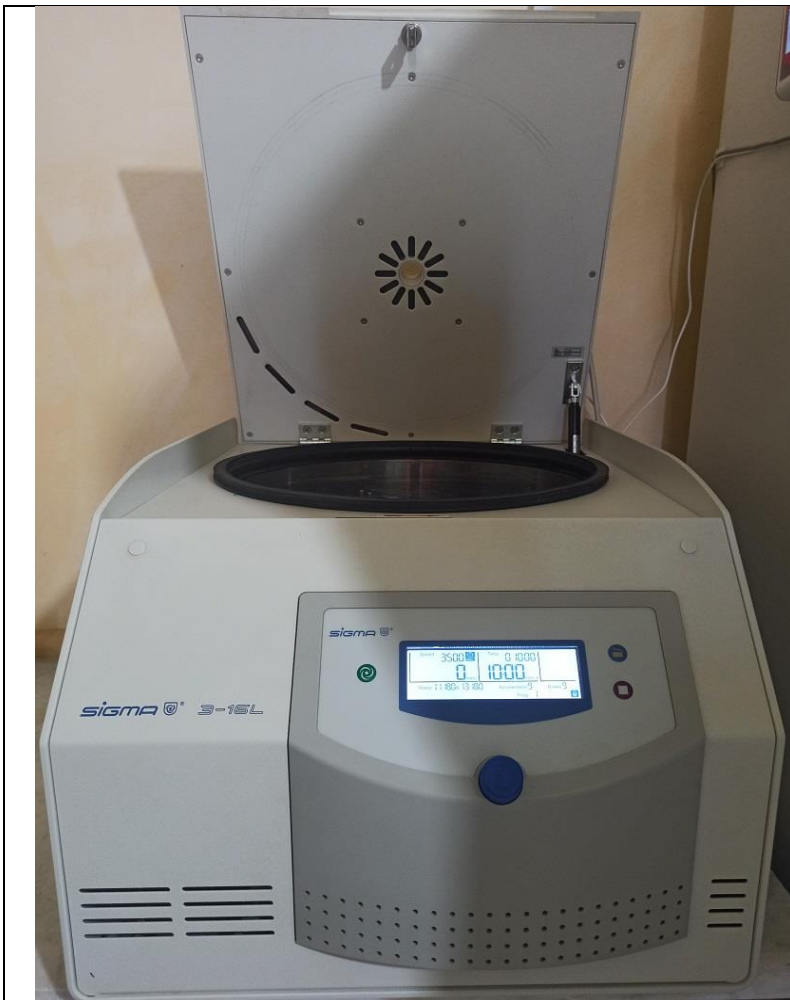
سانتریفیوژ سیگما Sigma centrifuge