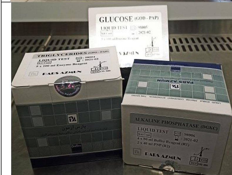
کیت تست های بیوشیمی شرکت پارس آزمون