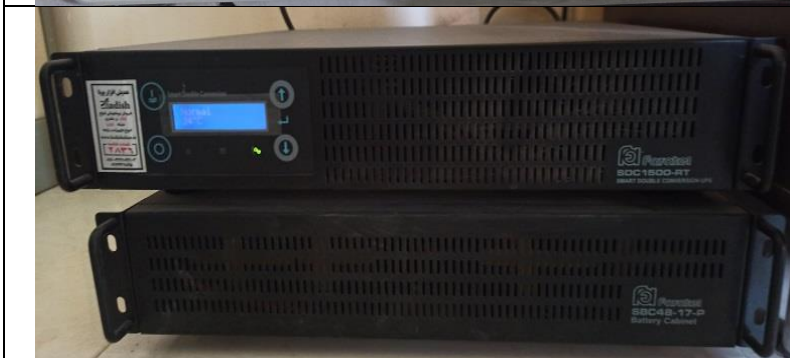
منبع تغذیه اضطراری (بدون توقف) Uninterruptible power supply