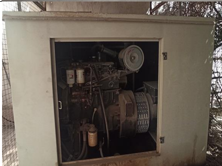
دیزل ژنراتور Diesel generator